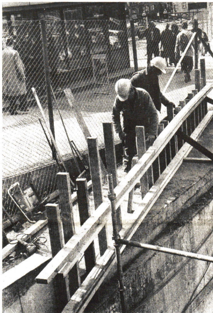
Oslo Byhall bygges ved hjelp av Eeg Henriksen Bygg A/s sine kontraktører.

I Sak nr. 410 som er et forslag vedrørende kontraktørvirk-